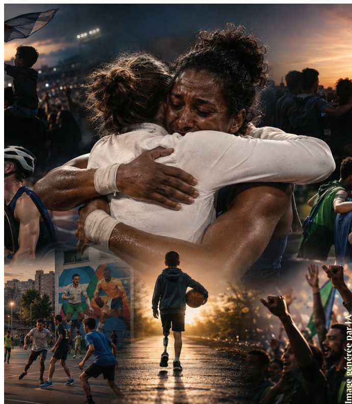
Image générée par IA

Favoriser une plus grande accessibilité et porosité entre les établissements scolaires et les associations locales, pour permettre aux élèves de découvrir et de pratiquer des activités physiques et sportives nouvelles.