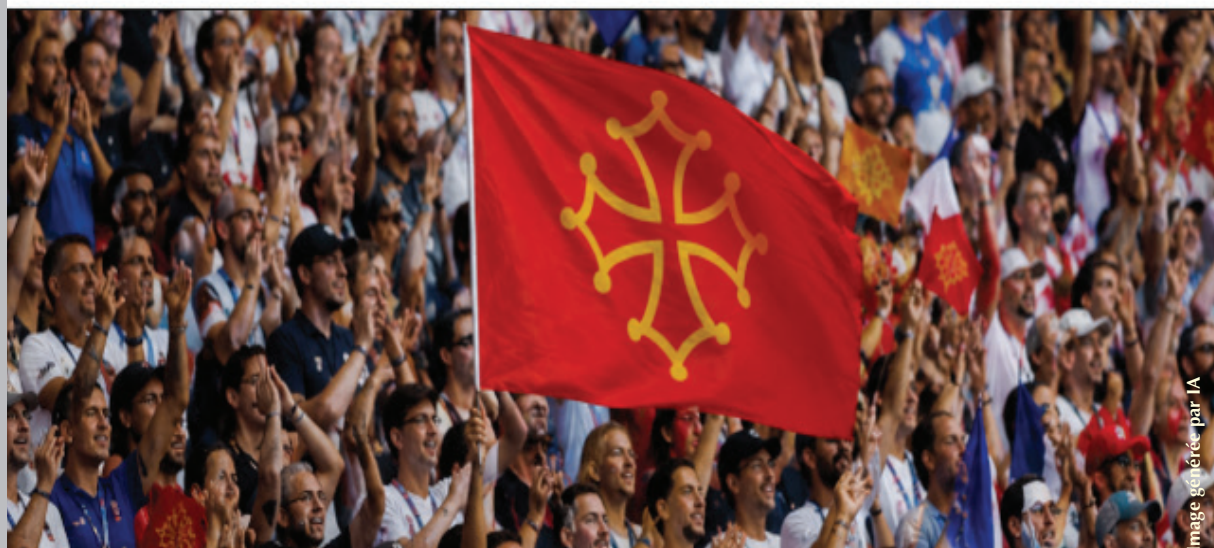
Image gérée par IA